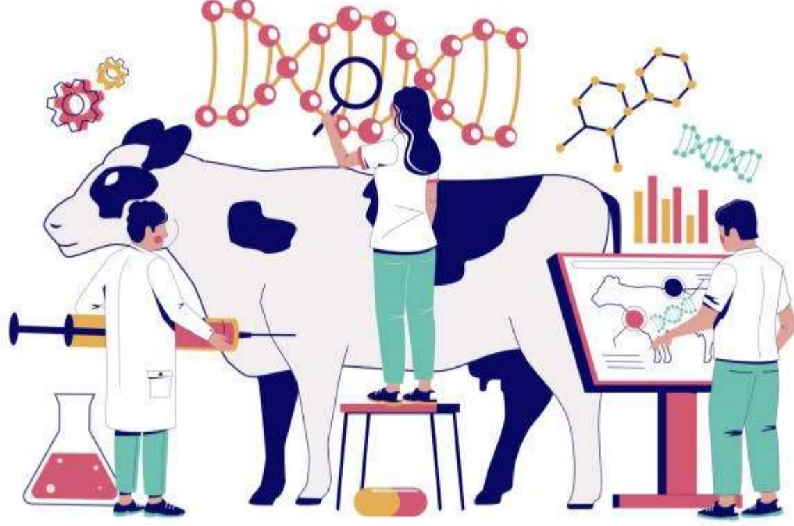
GENETICALLY MODIFIED ANIMALS